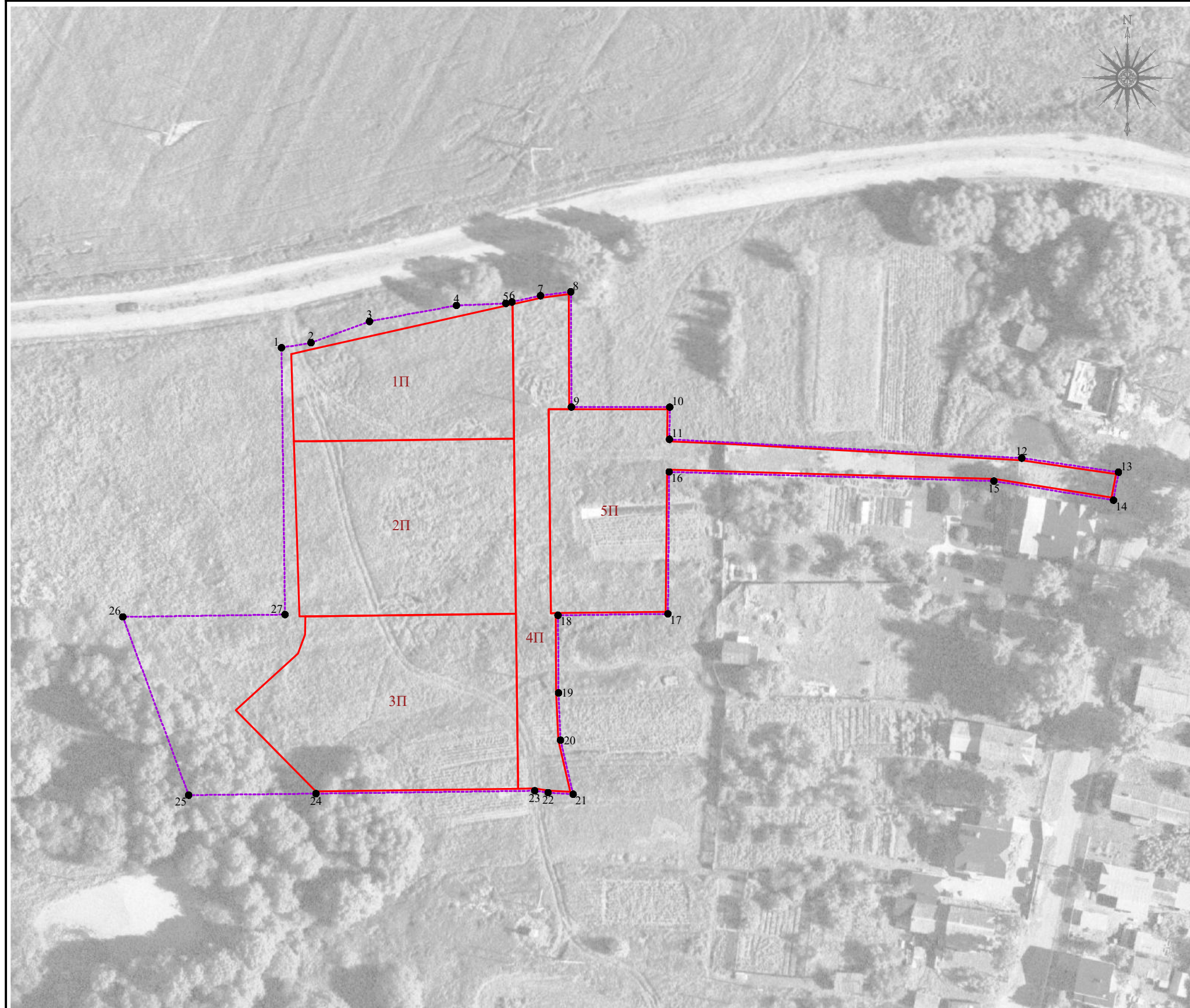
Каталог координат характерных точек границ территории в отношении которой утверждён проект межевания