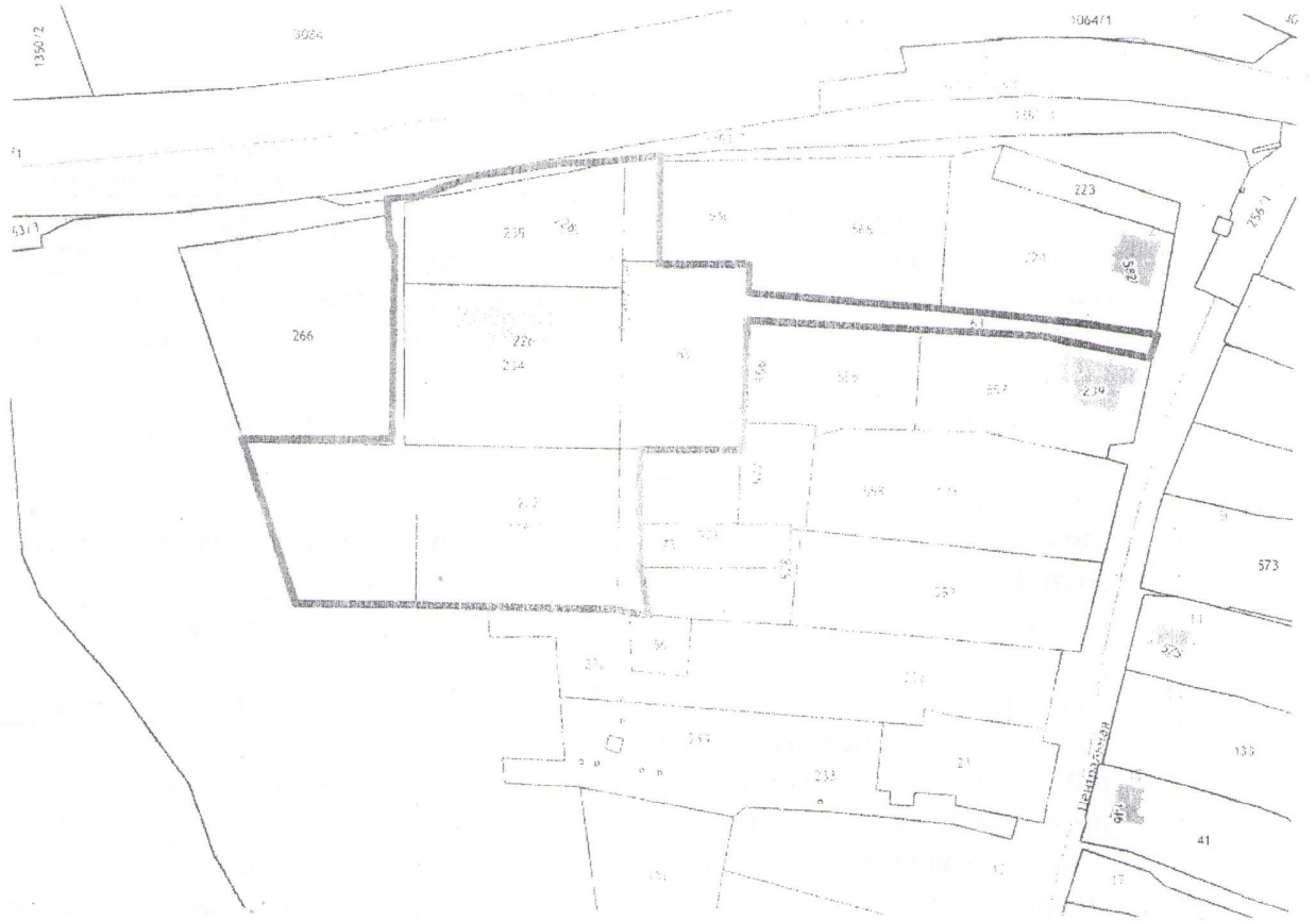
Схема границ территории планирования